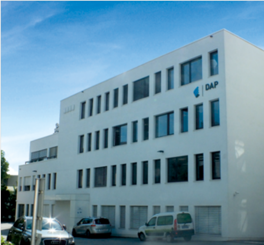
Bürogebäude des Software-Unternehmens DAP in Passau

DAP, der Softwareentwickler aus Passau, steht für seinen Slogan "doing IT better" und versteht sich als verantwortungsbewusster Partner seiner Kunden: Kompetent, ambitioniert und lösungsorientiert. Das branchenorientierte Serviceunternehmen entwickelt und bietet ein professionelles Leistungsangebot in den Bereichen