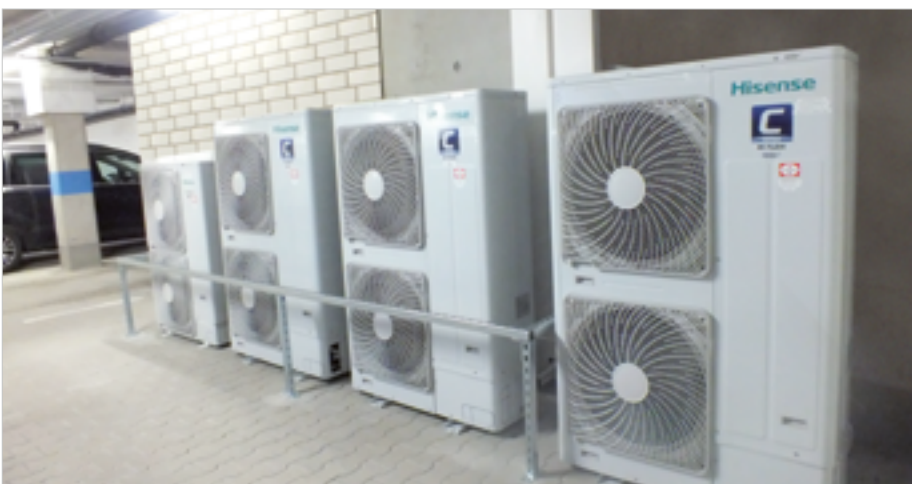
Kompakte MINI VRF-Außeneinheiten platzsparend aufgestellt in der Tiefgarage